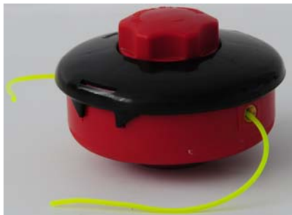
Шпуля «полуавтомат» 0809.005000